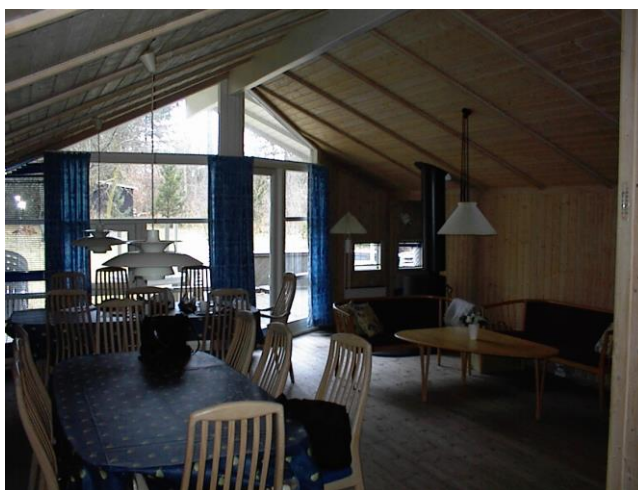
Stuen med udgang til terrassen.