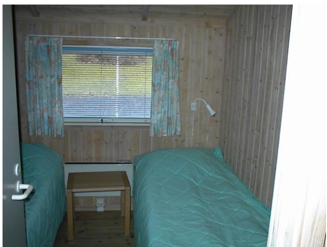
Et kig ind i et værelserne.